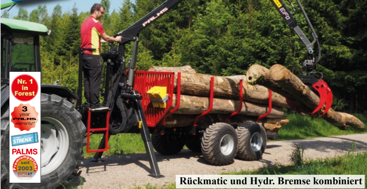
Rückmatic und Hydr. Bremse kombiniert

21.427,73 + MwSt. 4.071,27 = 25.499,- INKL. LIEFERUNG