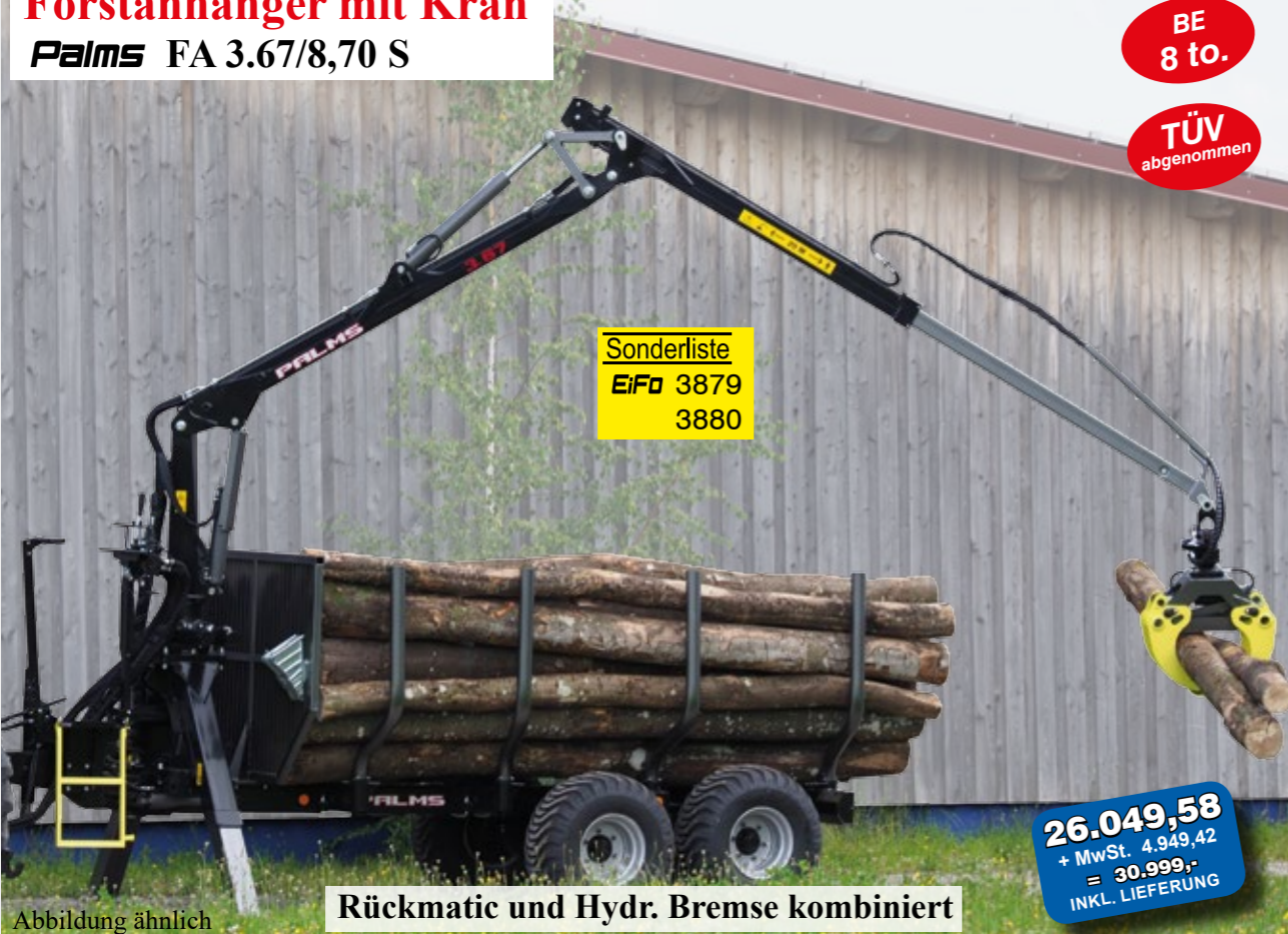
Rückmatic und Hydr. Bremse kombiniert