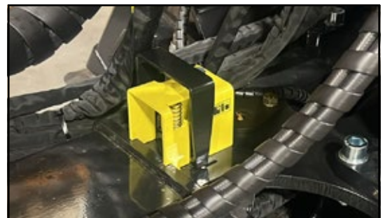
Neue Deichselverriegelung mit Automatikfunktion