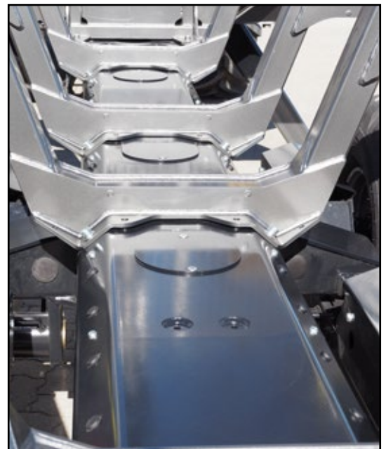
Die stabilen Rungenträger lassen sich einfach auf die gewünschten Abstände platzieren