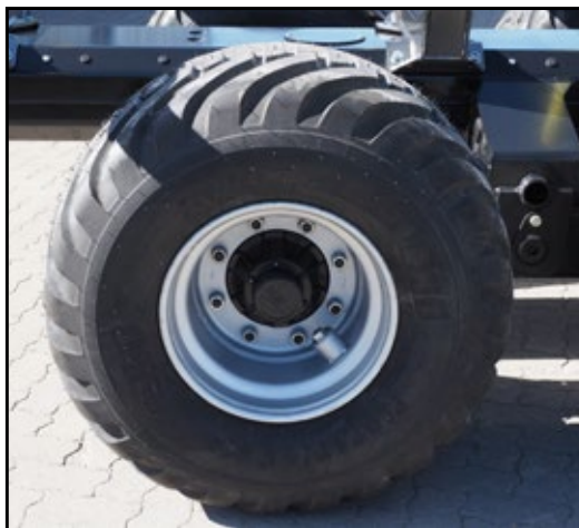
Stabile 8 Loch Felgen und große Bremsen