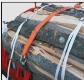
Spannen und Bündeln