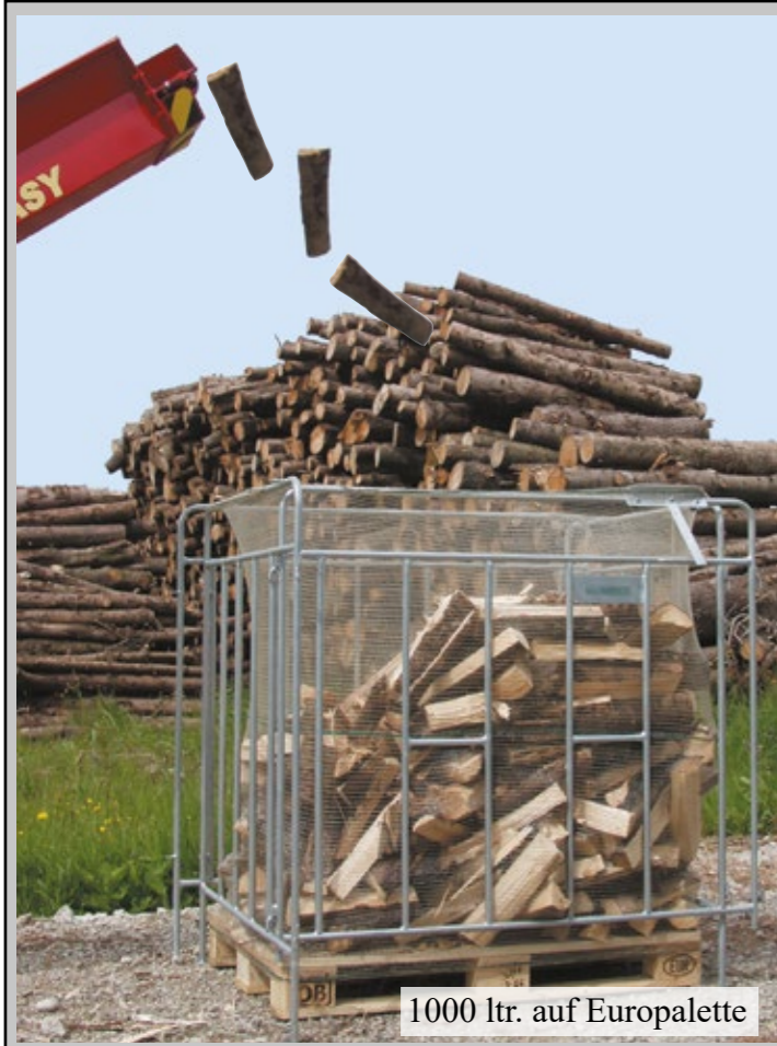
1000 ltr. auf Europalette