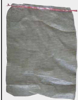
Abb. 60 ltr. Sack

EiFo Container Systeme Direkt vom Roh- oder Rundholz zum verpackten Brennholz – Keine zusätzliche Zwischenlagerung Schnellere Trocknung – Kürzere Lagerzeit Schnelle, einfache und saubere Verpackungseinheiten Verkauf Sackweise – Zufriedene Kunden Weniger Kapitaleinsatz